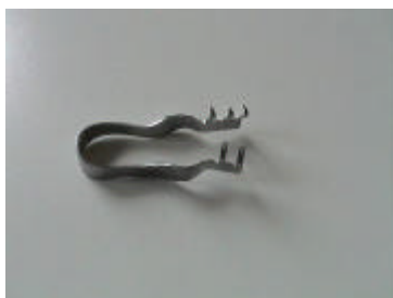
1 Wundspreizer Finsen