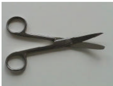
1 Cooper-Schere, gebogen, spitz/stumpf, 13 cm