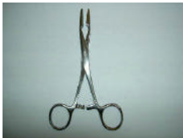
1 Kornzange, gerade, mit Sperre, 14 cm