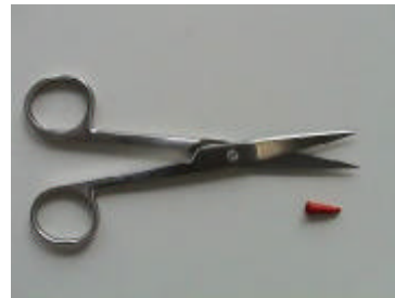
1 chir. Schere, gerade, spitz/spitz 14 cm