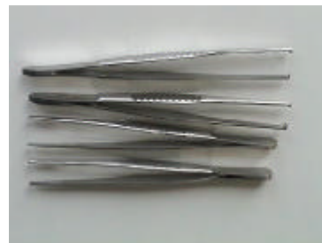
2 chir. Pinzette, gerade 14 cm (unten/links) 2 anat. Pinzette, gerade 14 cm (oben/rechts)