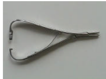
1 Nadelhalter Mathieu