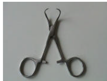
2 Tuchklemme Backhaus