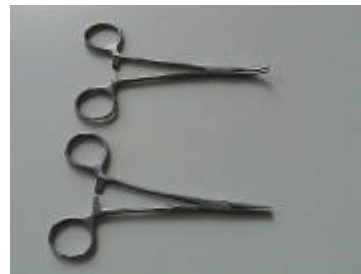
1 Mosquito-Klemme, gebogen (oben) 2 Mosquito-Klemme, gerade (unten)