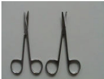
1 feine Schere, gerade, spitz/spitz, 11 cm (links) 1 feine Schere, gebogen, stumpf/stumpf, 11 cm (rechts)