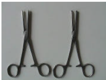
2 Peanklemmen, gerade, anatomisch, 14 cm (links) 2 Kocherklemmen, gerade, chirurgisch, 14 cm (rechts)