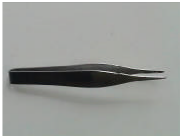
1 feine Pinzette, gerade